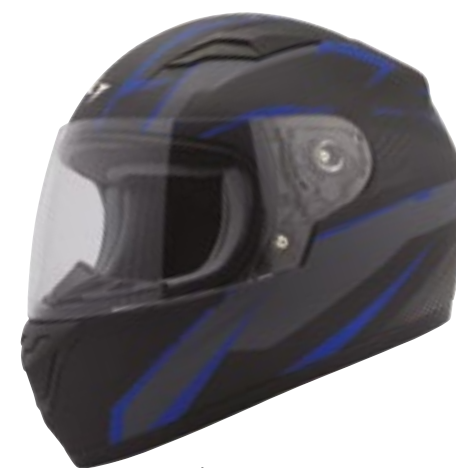
/ ARROW BLUE MATT 40D-F01-B01 XS à/à MD