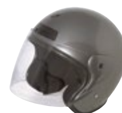
/ GREY GLOSSY 40N-SNU-G11 XS à/roXL