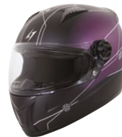
/ FLORA BLACK FUCHSIA METAL MATT 40D-B01-E01 XS à/à XXL