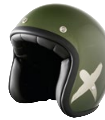
/ X-RIDER - KAKI / SILVER GREY GLOSSY 40K-PED-H04 XXS à/à XL