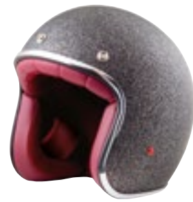
/ GLITTER BLACK GLOSSY 40K-PEU-P10 XXS à/à XL