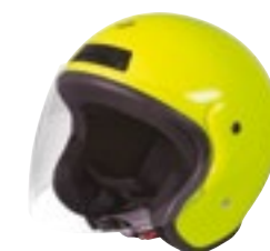
/ NEON YELLOW GLOSSY 40N-SNU-A10 XS à/ro XL