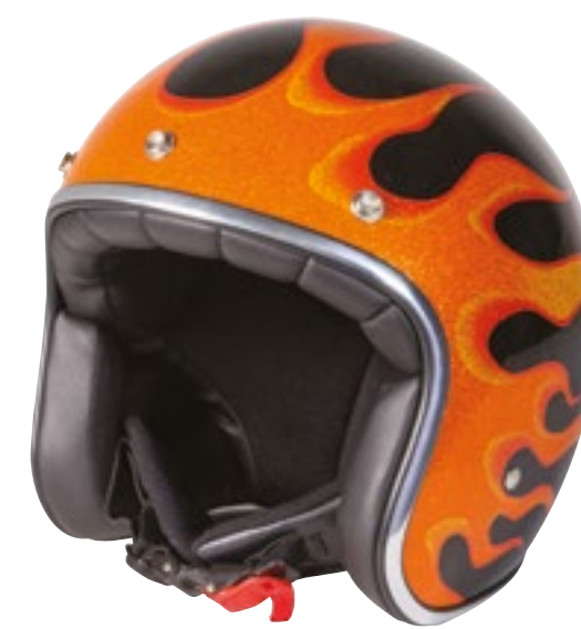
/ FIRE ORANGE METAL GLOSSY 40K-PED-Q02 XS à/ro XL