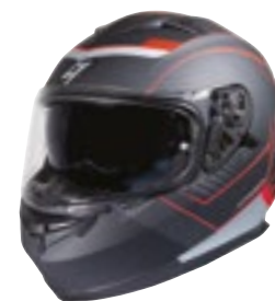
/ MILES RED METAL MATT 40A-A01-B02 XS à/à XXL

PINLOCK 70 Pièce détaché disponible / available spare part LENTILLE PINLOCK 70 4125-P02-A01