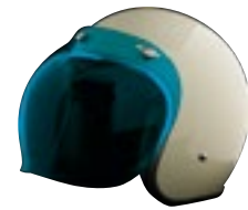
/ ÉCRAN BUBBLE BLEU / BLUE BUBBLE SCREEN 4120-PEU-B01