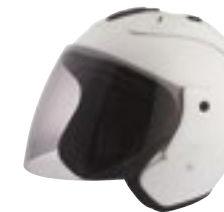
/ WHITE GLOSSY 40G-C01-B02 XS à/to XL