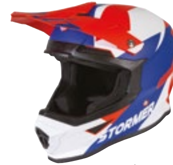
/ SQUAD BLUE RED GLOSSY 40A-D01-B02 XS à/à XXL