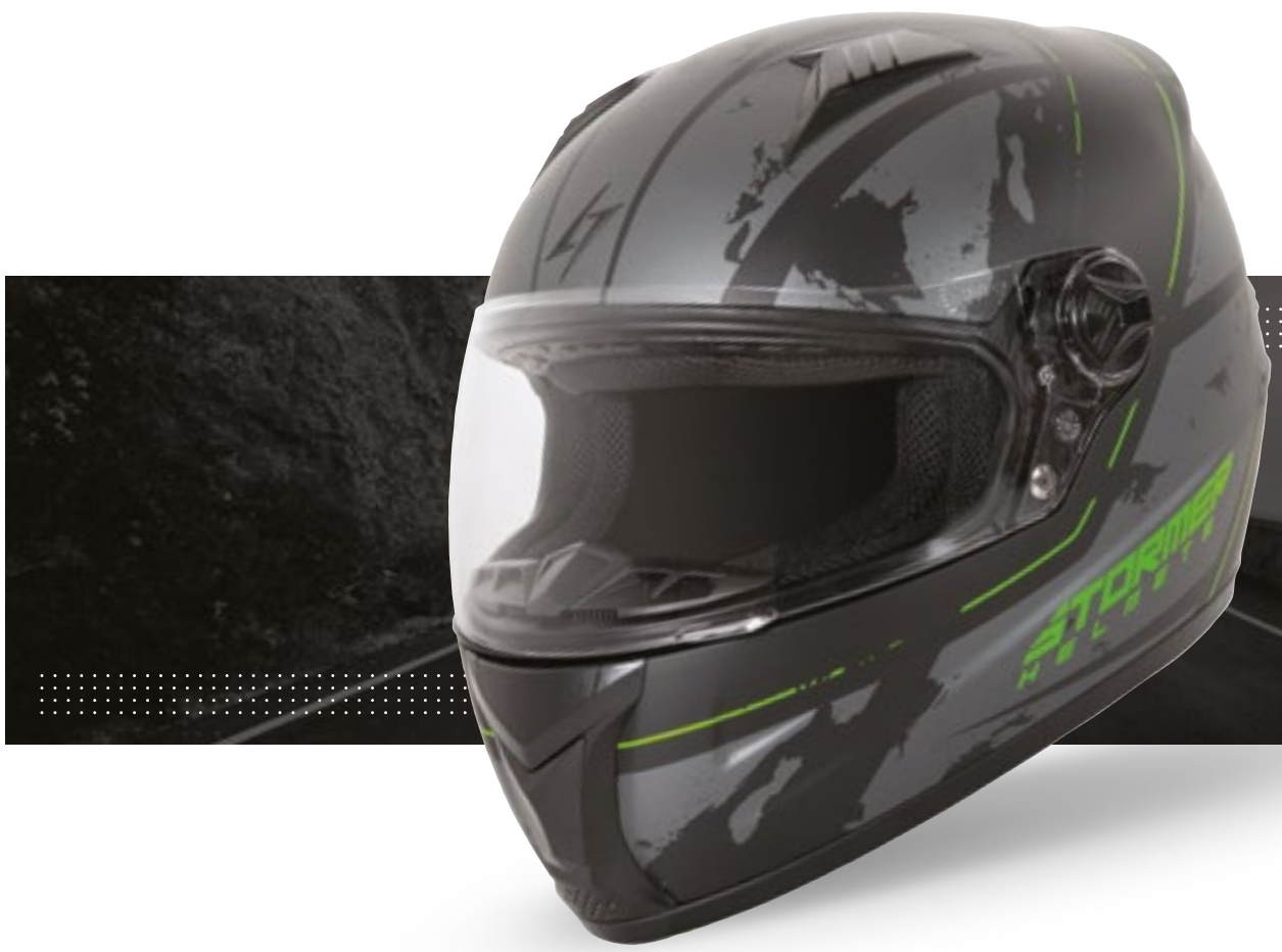
/ SHADE BLACK GREEN METAL MATT 40D-B01-C02 XS à/à XXL