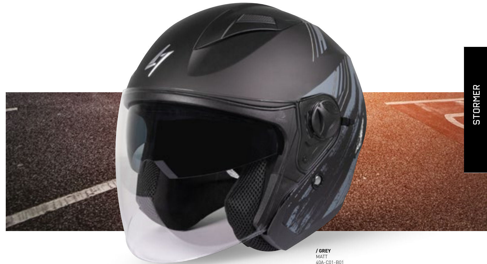
/ GREY MATT 40A-C01-B01 XS à/à XXL

JET OPEN FACE XS > XXL (selon modèle) (according to the model)