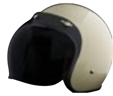
/ ÉCRAN BUBBLE FUMÉ FONCÉ / DARK SMOKE BUBBLE SCREEN 4120-PEU-S25