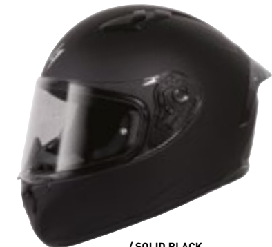
/ SOLID BLACK MATT 40A-F01-A01 XS à/à XXL