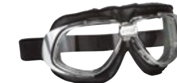
/ T10 CHROME 40I-2700-T10