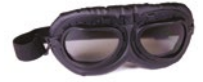
/ T01 BLACK 40I-2710-T01