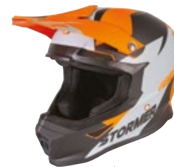
/ SQUAD GREY ORANGE MATT 40A-D01-B03 XS à/à XXL

OFF-ROAD XS > XXL (selon modèle) (according to the model)