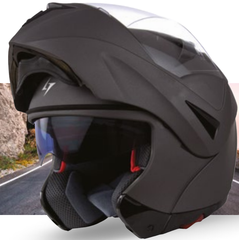
/ GREY MATT 40H-A01-A03 XS à/à XL