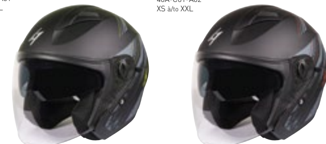
/ NEON YELLOW MATT 40A-C01-B02 XS à/à XXL