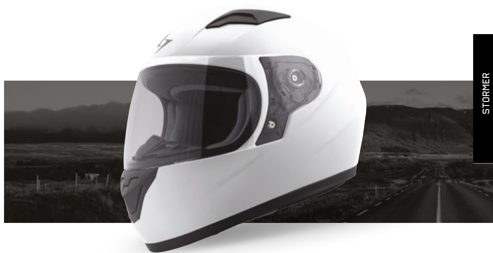
/ WHITE GLOSSY 40D-F01-A01 XS à/à MD