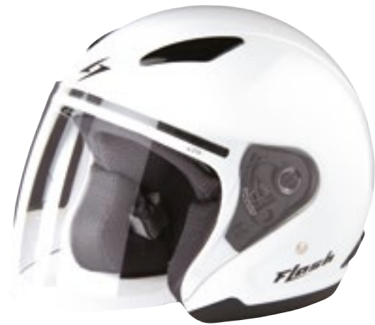
/ WHITE GLOSSY 40R-FSU-B10 XS à/à MD