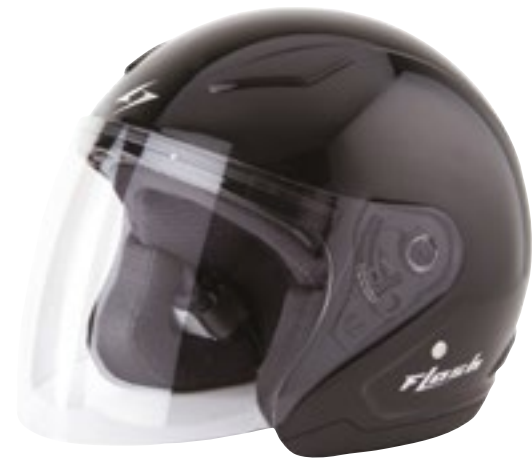
/ BLACK GLOSSY 40R-FSU-N10 XS à/à MD