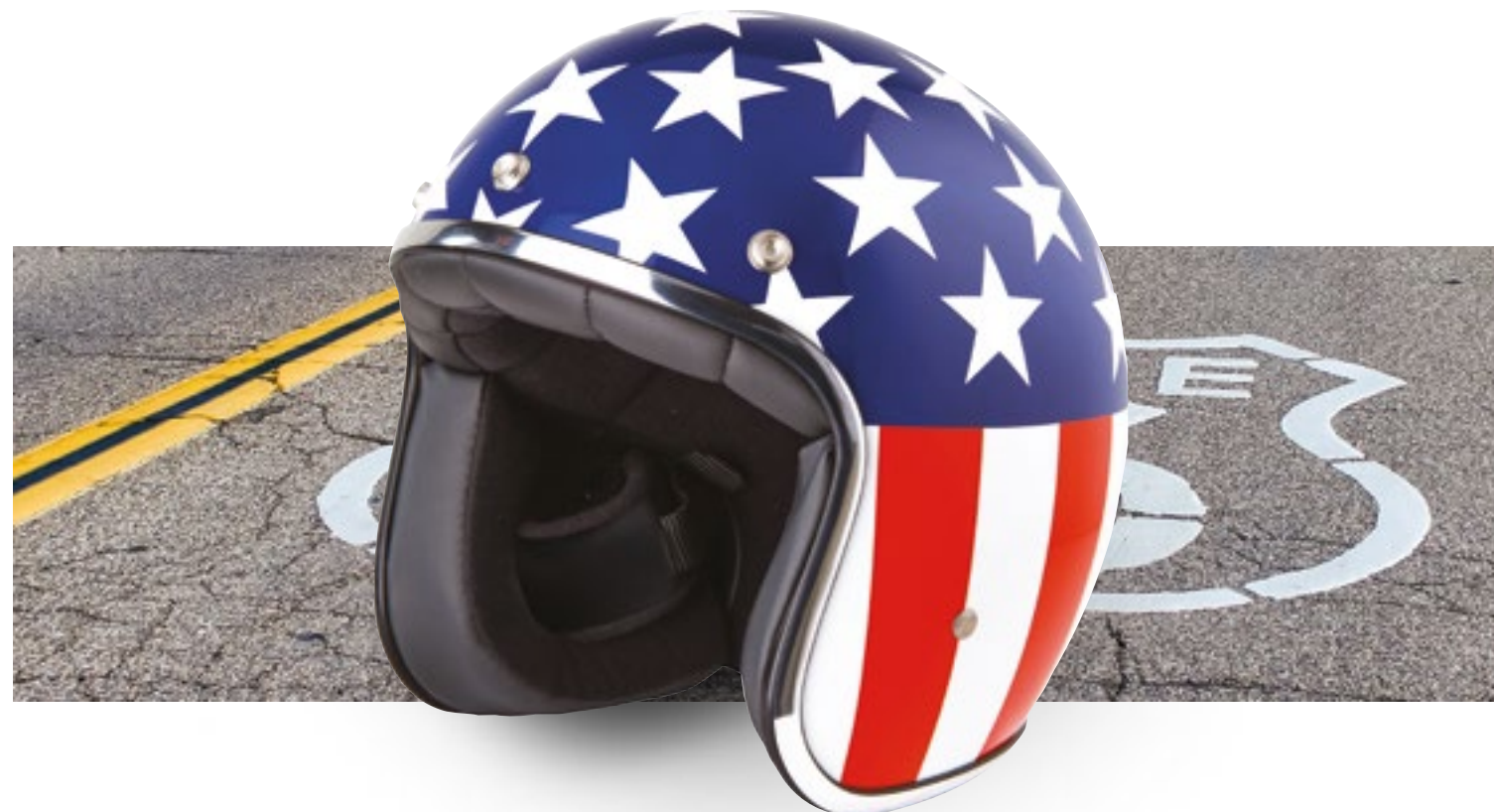
/ US GLOSSY 40K-PED-E01 XS à/à XL

JET OPEN FACE XXS > XL (selon modèle) (according to the model)