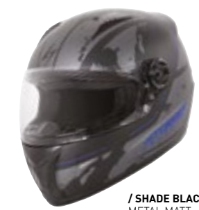
/ SHADE BLACK BLUE METAL MATT 40D-B01-C01 XS à/à XXL