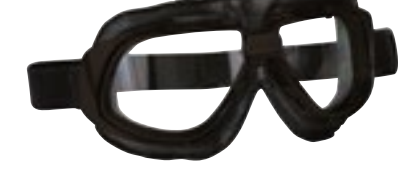
/ T10 MATT BLACK 40I-2710-T10