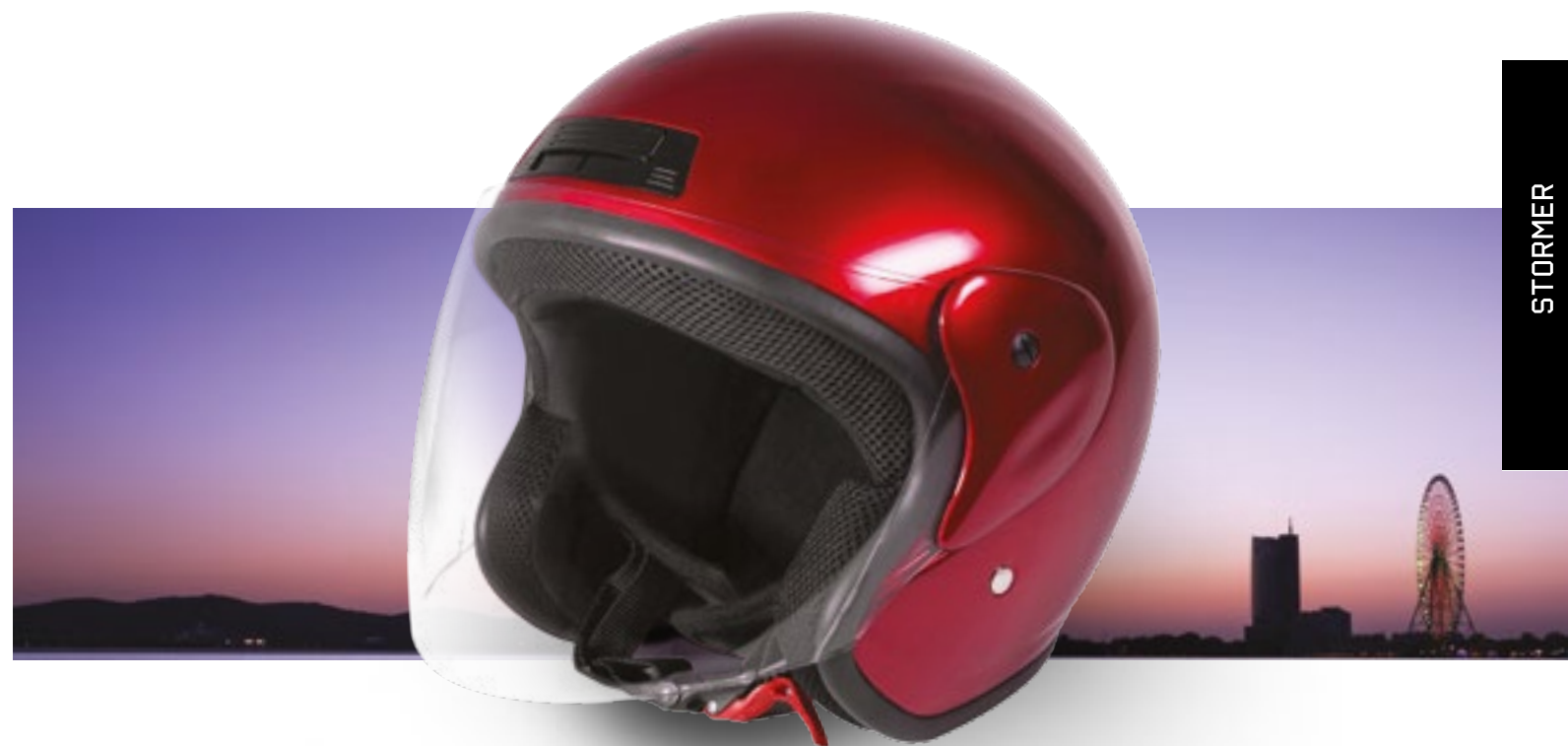
/ CALM RED METAL GLOSSY 40N-SNU-A09 XS à/ro XL