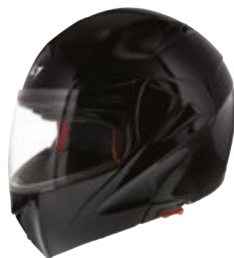
/ BLACK GLOSSY 40H-A01-A01 XS à/à XL