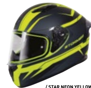
/ STAR NEON YELLOW BLACK GREY METALLIC MATT 40A-F01-B03 XS à/à XXL

PINLOCK 70 Pièce détachée disponible / available spare part LENTILLE PINLOCK 70 4125-P02-A01