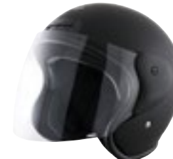
/ BLACK MATT 40Q-SNU-N26 XS à/roXL