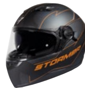
/ BLAZE ORANGE METAL MATT 40D-A01-C02 XS à/à XXL

PINLOCK 30 Livré avec Pinlock Helmet delivered with Pinlock