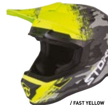
/ FAST YELLOW MATT 40A-D01-A02 XS à/à XXL