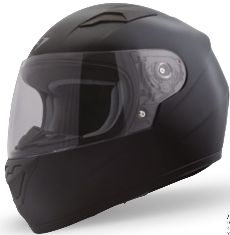
/ BLACK GLOSSY 40D-F01-A02 XS à/à MD