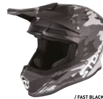
/ FAST BLACK MATT 40A-D01-A01 XS à/à XXL