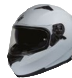
/ SOLID NARDO GREY GLOSSY 40A-A01-A02 XS à/à XXL