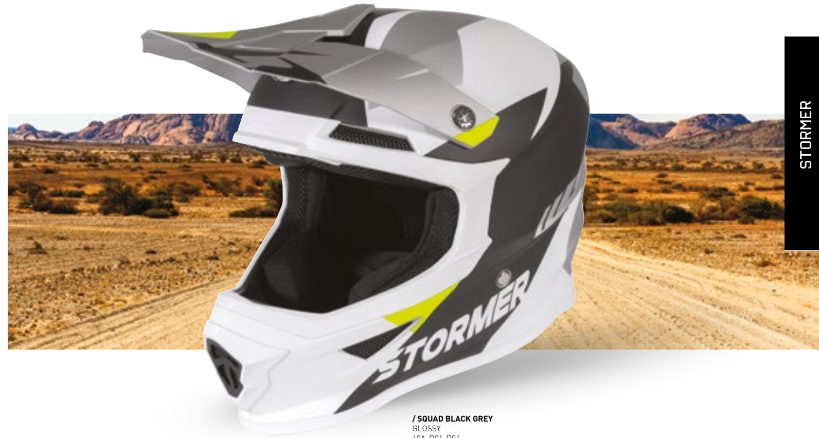
/ SQUAD BLACK GREY GLOSSY 40A-D01-B01 XS à/à XXL

OFF-ROAD XS > XXL (selon modèle) (according to the model)