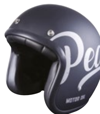
/ OIL MATT 40K-PED-L01 XS à/à XL