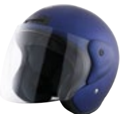
/ ROYAL BLUE METAL MATT 40N-SNU-A06 XS à/roXL