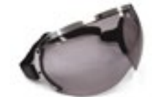
/ ÉCRAN PEARL AVIATEUR FUMÉ / AVIATOR SCREEN SMOKE PEARL 4120-PEU-A03