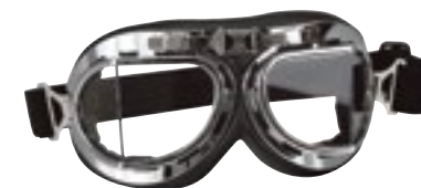
/ T08 CHROME 40I-2700-T08