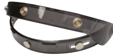
/ CHARNIÈRE ÉCRAN PEARL NOIR / BLACK PEARL SCREEN HINGE 4125-PEU-A02