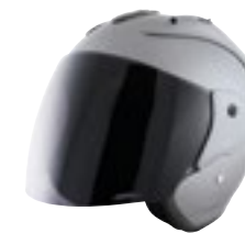
/ NARDO GREY GLOSSY 40G-C01-C01 XS à/to XL