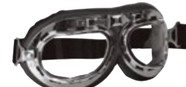
/ T01 CHROME 40I-2700-T01