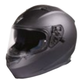
/ SOLID BLACK MATT 40A-A01-A01 XS à/à XXL