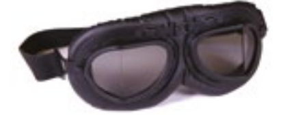
/ T08 BLACK 40I-2710-T08