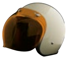
/ ÉCRAN BUBBLE ORANGE / ORANGE BUBBLE SCREEN 4120-PEU-B02