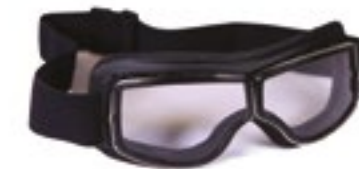
/ T05 BLACK 40I-2710-T05