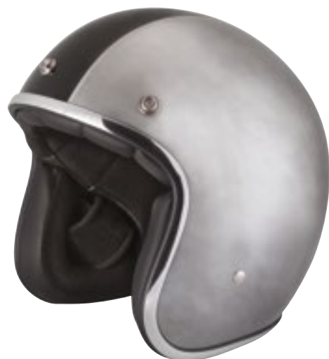
/ WAX GLOSSY 40K-PED-I01 XS à/à XL