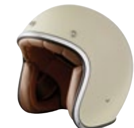
/ OFF-WHITE GLOSSY 40K-PEU-A01 XXS à/à XL