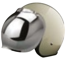
/ ÉCRAN BUBBLE IRIIDIUM / IRIIDIUM BUBBLE SCREEN 4120-PEU-R20