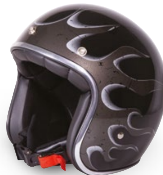
/ FIRE BLACK METAL GLOSSY 40K-PED-Q01 XS à/ro XL