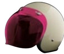
/ ÉCRAN BUBBLE ROSE / PINK BUBBLE SCREEN 4120-PEU-B03