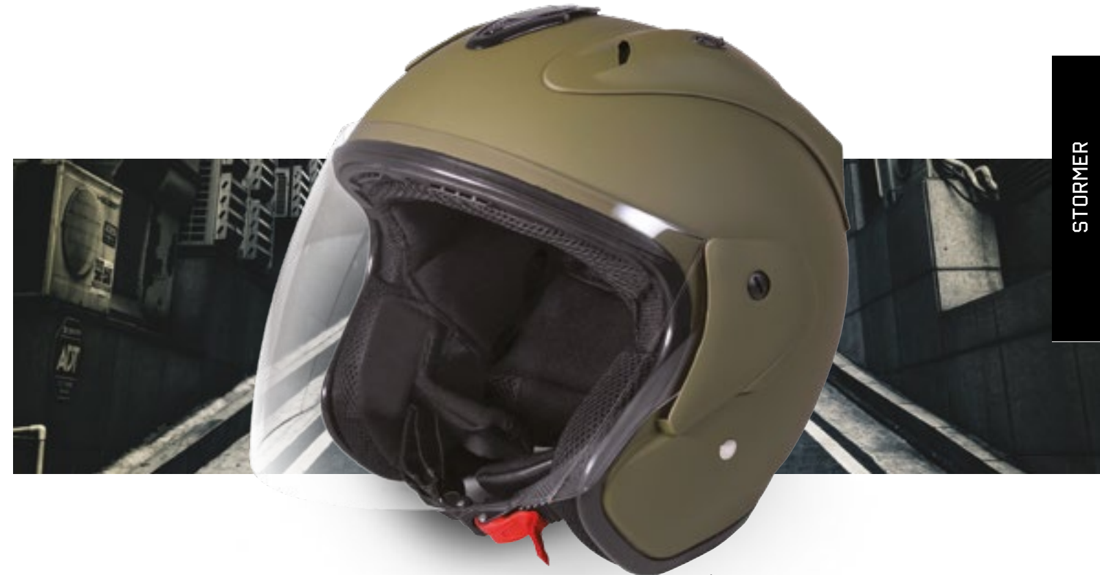
/ KAKI MATT 40G-C01-C04 XS à/to XL