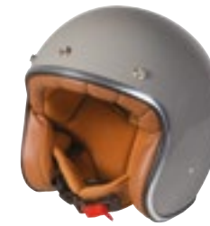
/ NARDO GREY GLOSSY 40K-PEU-A04 XXS à/à XL

JET OPEN FACE XXS > XL (selon modèle) (according to the model)