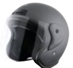
/ GREY MATT 40N-SNU-G18 XS à/roXL