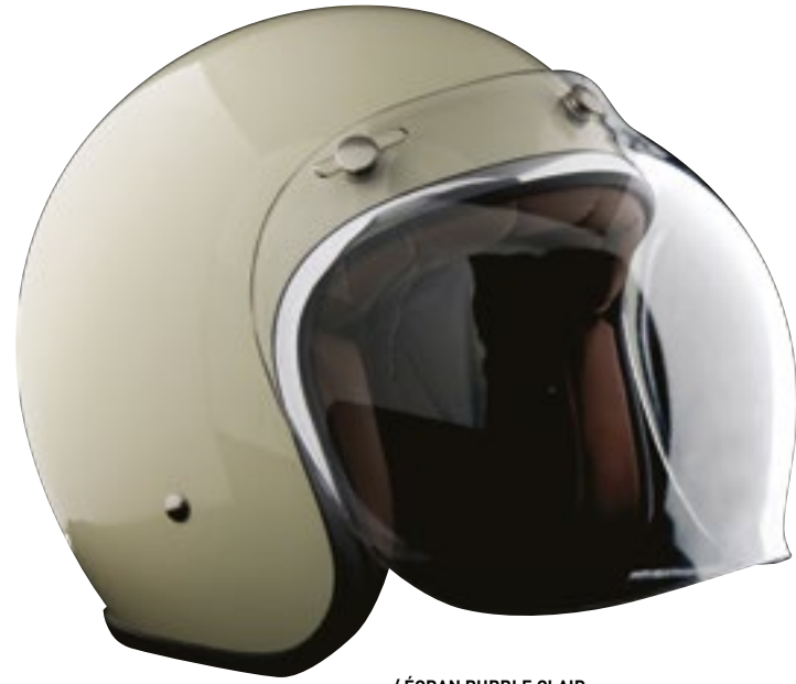
/ ÉCRAN BUBBLE CLAIR / CLEAR BUBBLE SCREEN 4120-PEU-C20