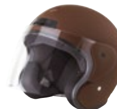
/ CHOCOLATE MATT 40N-SNU-C15 XS à/roXL