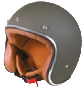
/ KAKI MATT 40K-PEU-A03 XS à/à XL