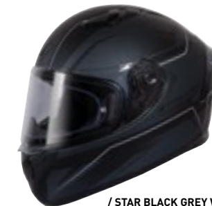
/ STAR BLACK GREY WHITE METALLIC MATT 40A-F01-B02 XS à/à XXL