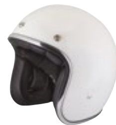
/ WHITE GLOSSY 40K-PEU-B10 XXS à/à XL