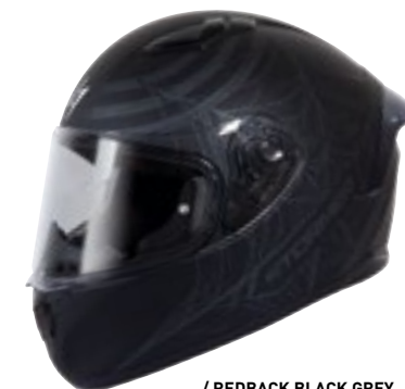
/ REDBACK BLACK GREY MATT 40A-F01-C01 XS à/à XXL