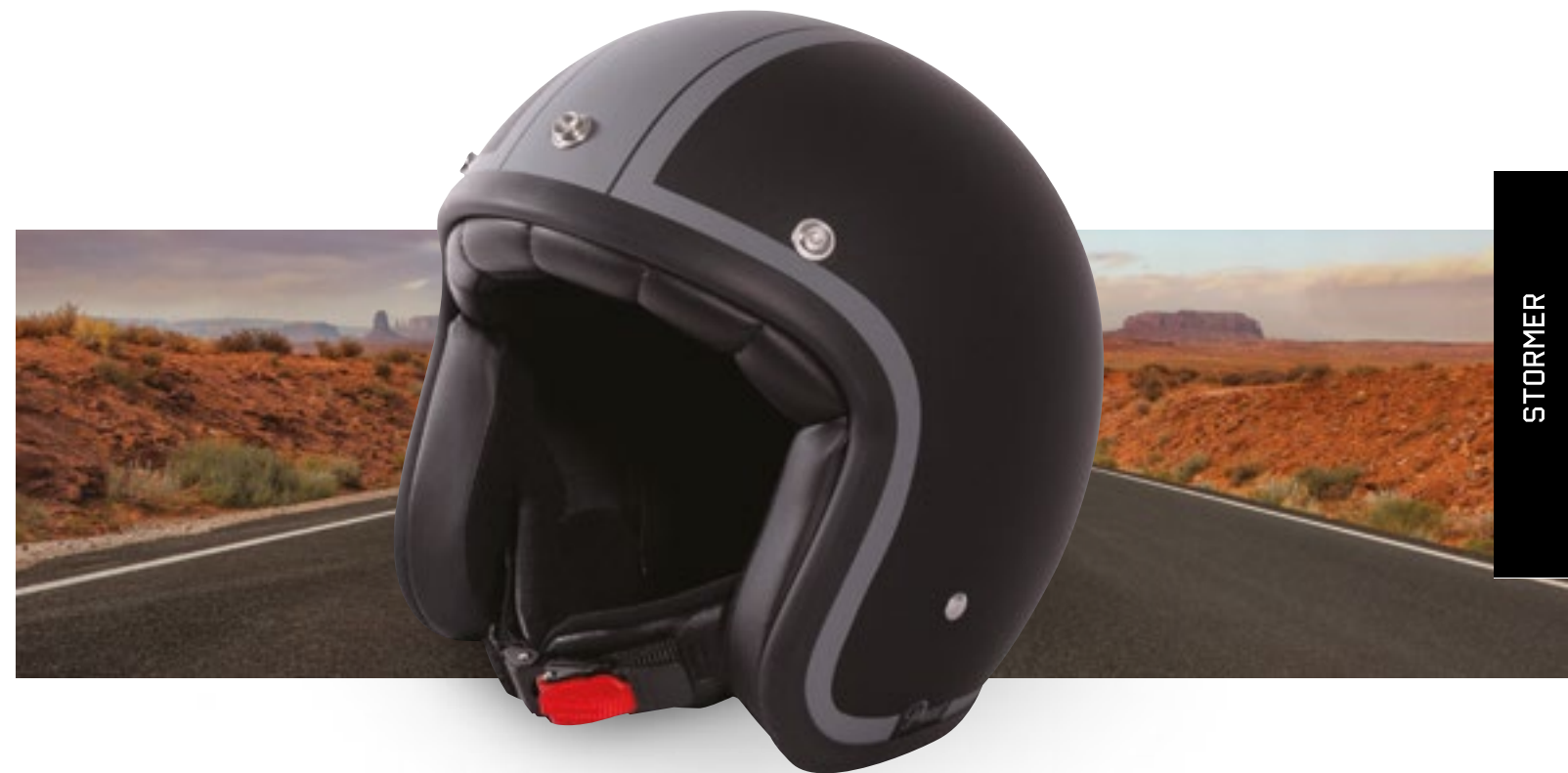
/ ADVENTURE METAL MATT 40K-PED-P01 XS à/ro XL