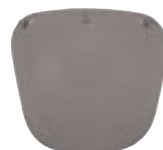
/ ÉCRAN FUMÉ FONCÉ / DARK SMOKE SCREEN 4120-PEU-A02