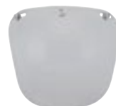
/ ÉCRAN CLAIR / CLEAR SCREEN 4120-PEU-A01