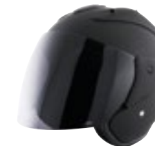
/ BLACK MATT 40G-C01-A01 XS à/to XL