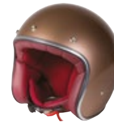
/ CHAMPAGNE GLOSSY 40K-PEU-A02 XXS à/à XL