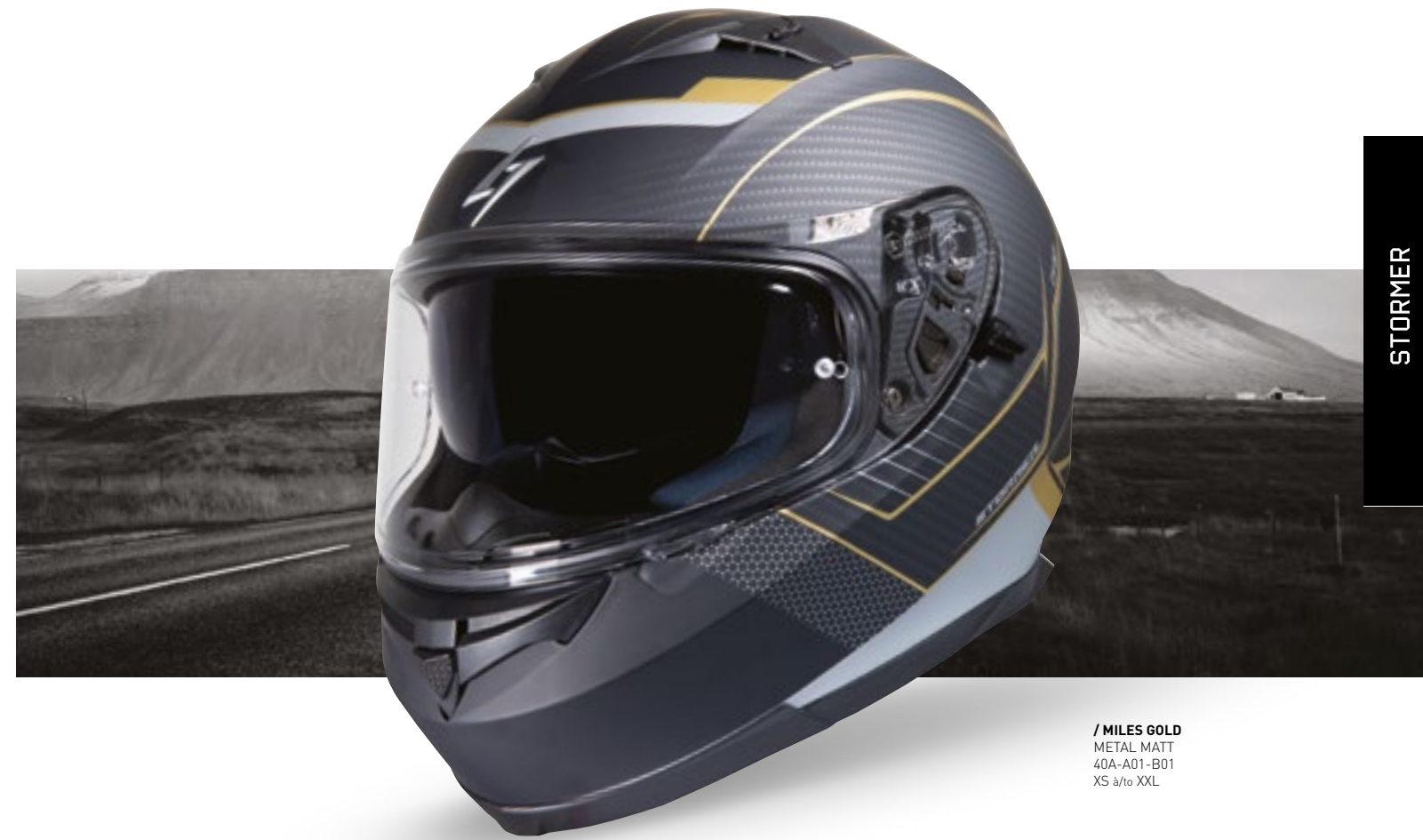
/ MILES GOLD METAL MATT 40A-A01-B01 XS à/à XXL