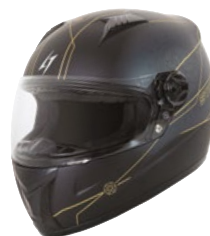
/ FLORA BLACK GOLD METAL MATT 40D-B01-E02 XS à/à XXL

INTÉGRAL FULL FACE XS > XXL (selon modèle) (according to the model)