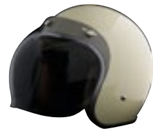
/ ÉCRAN BUBBLE FUMÉ / SMOKE BUBBLE SCREEN 4120-PEU-S20