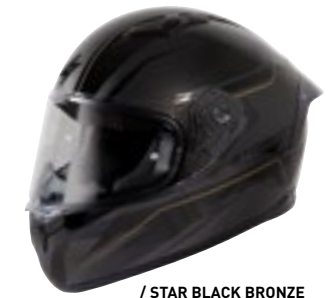
/ STAR BLACK BRONZE GLOSSY 40A-F01-B01 XS à/à XXL