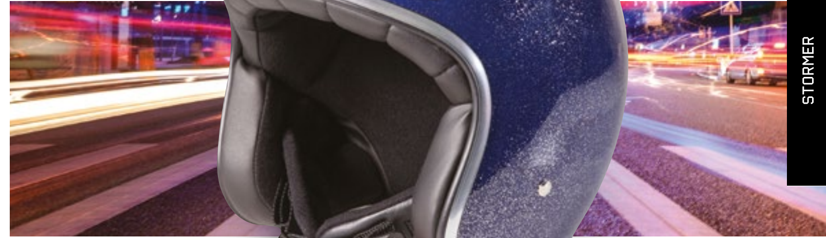
/ GLITTER NAVY BLUE GLOSSY 40K-PED-M01 XXS à/à XL