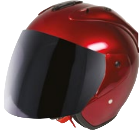
/ METALLIC CALM RED GLOSSY 40G-C01-C02 XS à/to XL