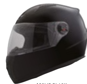
/ SOLID BLACK GLOSSY 40D-B01-A02 XS à/à XL