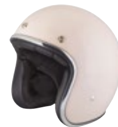
/ PALE PINK GLOSSY 40K-PEU-B01 XXS à/à XL