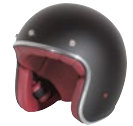
/ BLACK MATT 40K-PEU-N26 XXS à/à XL