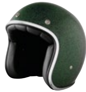
/ GLITTER GREEN GLOSSY 40K-PEU-P14 XXS à/à XL