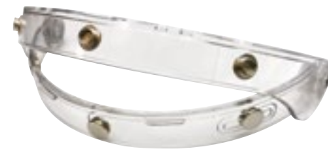
/ CHARNIÈRE ÉCRAN PEARL TRANSPARENT / TRANSPARENT PEARL SCREEN HINGE 4125-PEU-A01