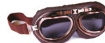
/ T01 RETRO 40I-2720-T01