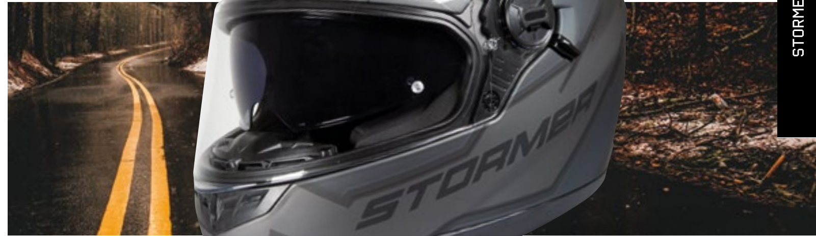
/ BLAZE GREY BLACK METAL MATT 40D-A01-C01 XS à/à XXL

INTÉGRAL DOUBLE ÉCRAN FULL FACE DUAL SCREEN XS > XXL (selon modèle) (according to the model)