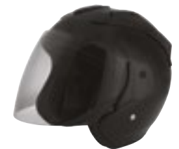
/ BLACK GLOSSY 40G-C01-B01 XS à/to XL