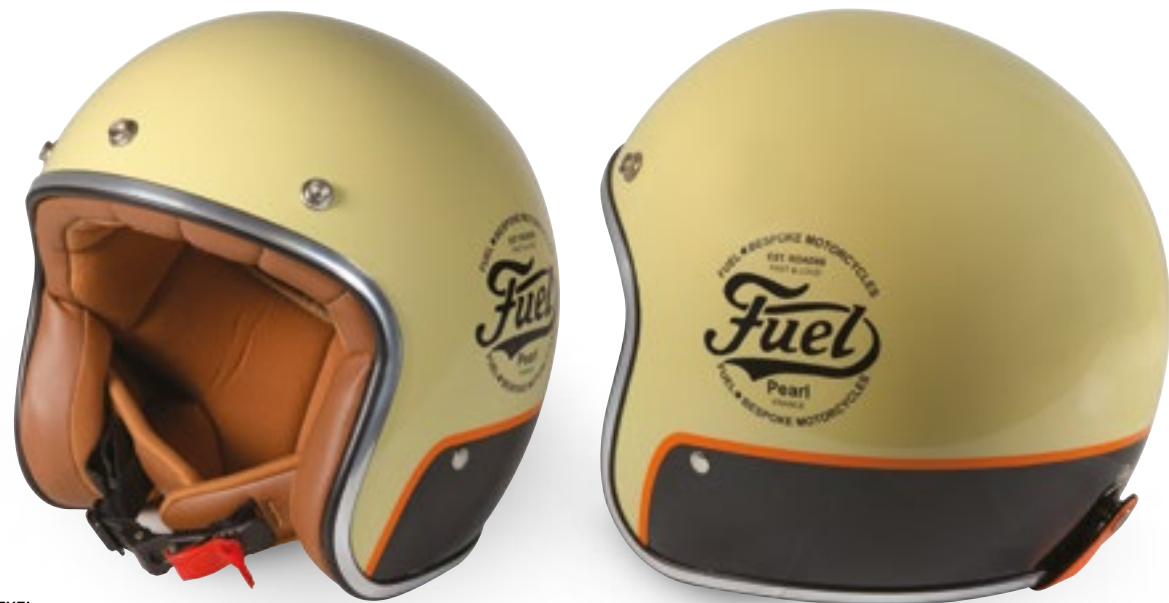
/ FUEL GLOSSY 40K-PED-R01 XS à/ro XL