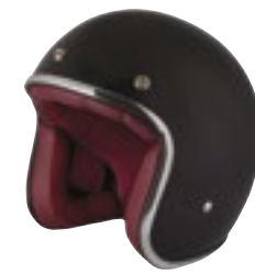
/ BLACK GLOSSY 40K-PEU-N10 XXS à/à XL