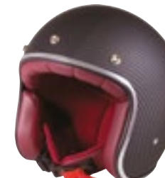
/ CARBON MATT 40K-PED-N01 XS à/à XL