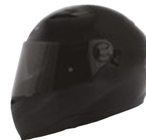
/ SOLID BLACK GLOSSY 40D-A01-A02 XS à/à XXL