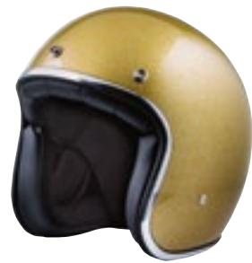
/ GLITTER GOLD GLOSSY 40K-PEU-P12 XXS à/à XL