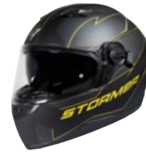
/ BLAZE YELLOW METAL MATT 40D-A01-C03 XS à/à XXL