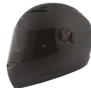
/ SOLID BLACK MATT 40D-A01-A03 XS à/à XXL