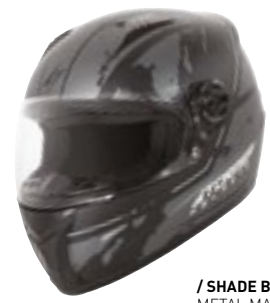
/ SHADE BLACK WHITE METAL MATT 40D-B01-C03 XS à/à XXL