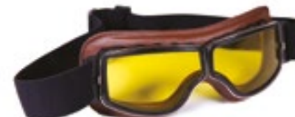
/ T05 RETRO 40I-2720-T05