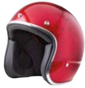
/ GLITTER RED GLOSSY 40K-PEU-P11 XXS à/à XL