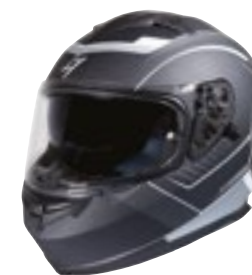
/ MILES WHITE METAL MATT 40A-A01-B03 XS à/à XXL