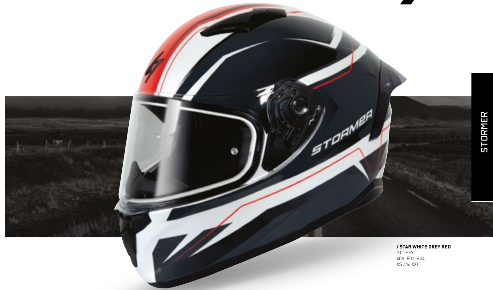
/ STAR WHITE GREY RED GLOSSY 40A-F01-B04 XS à/à XXL

INTÉGRAL FULL FACE XS > XXL (selon modèle) (according to the model)