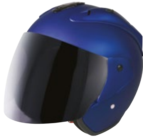
/ METALLIC DEEP BLUE MATT 40G-C01-C03 XS à/to XL