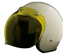
/ ÉCRAN BUBBLE JAUNE / YELLOW BUBBLE SCREEN 4120-PEU-J20