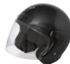
/ BLACK GLOSSY 40R-SNU-N10 XS à/roXL