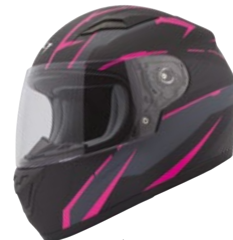
/ ARROW NEON PINK MATT 40D-F01-B02 XS à/à MD