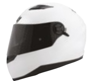
/ SOLID WHITE GLOSSY 40D-A01-A01 XS à/à XL