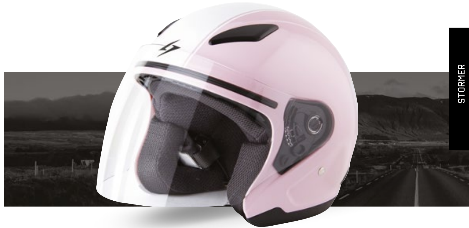
/ KOKOALA GLOSSY 40R-FSD-KK1 XS à/à MD