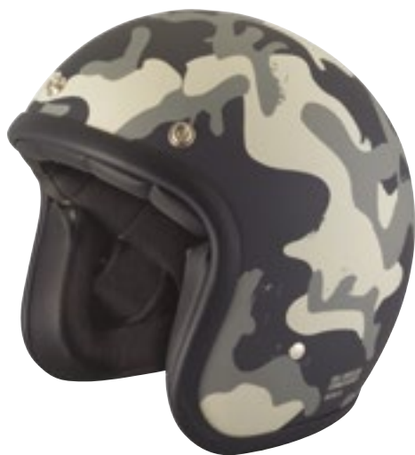
/ CAMO MATT 40K-PED-J01 XS à/à XL