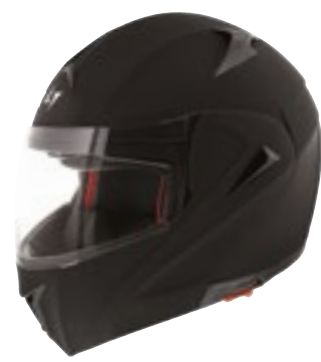
/ BLACK MATT 40H-A01-A02 XS à/à XL