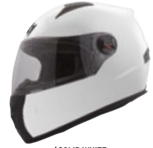
/ SOLID WHITE GLOSSY 40D-B01-A01 XS à/à XL