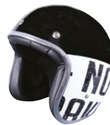
/ BRAKIN GLOSSY 40K-PED-K01 XS à/à XL