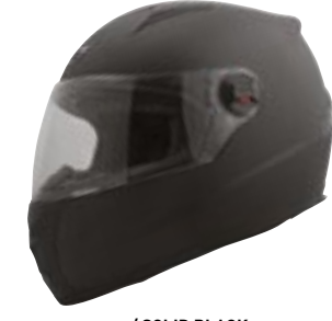
/ SOLID BLACK MATT 40D-B01-A03 XS à/à XXL