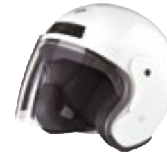
/ WHITE GLOSSY 40N-SNU-B10 XS à/roXL