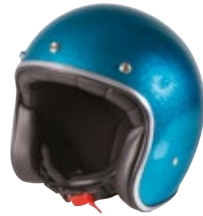
/ GLITTER TURQUOISE GLOSSY 40K-PED-M02 XXS à/à XL