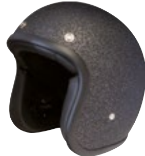
/ GLITTER BLACK MATT 40K-PEU-P13 XXS à/à XL