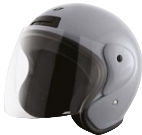
/ NARDO GREY GLOSSY 40N-SNU-A08 XS à/ro XL