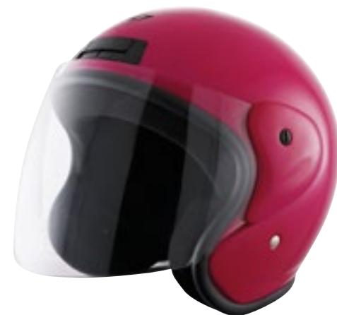
/ FUCHSIA GLOSSY 40N-SNU-A07 XS à/ro XL