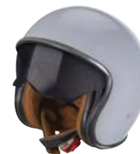
/ NARDO GREY GLOSSY 40A-B01-A05 XS à/à XXL