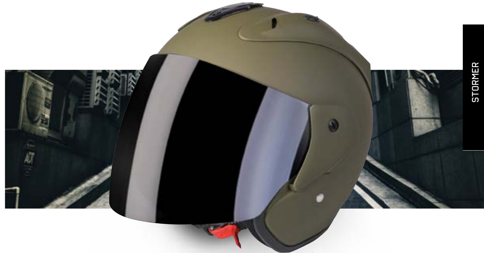
/ KAKI MATT 40G-C01-C04 XS à/à XL