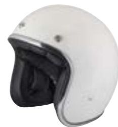
/ WHITE GLOSSY 40K-PEU-B10 XXS à/à XL