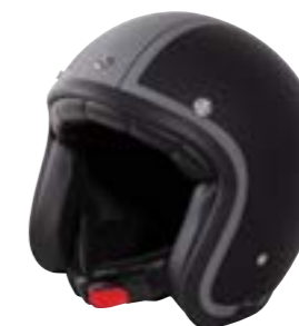
/ ADVENTURE METAL MATT 40K-PED-P01 XS à/à XL