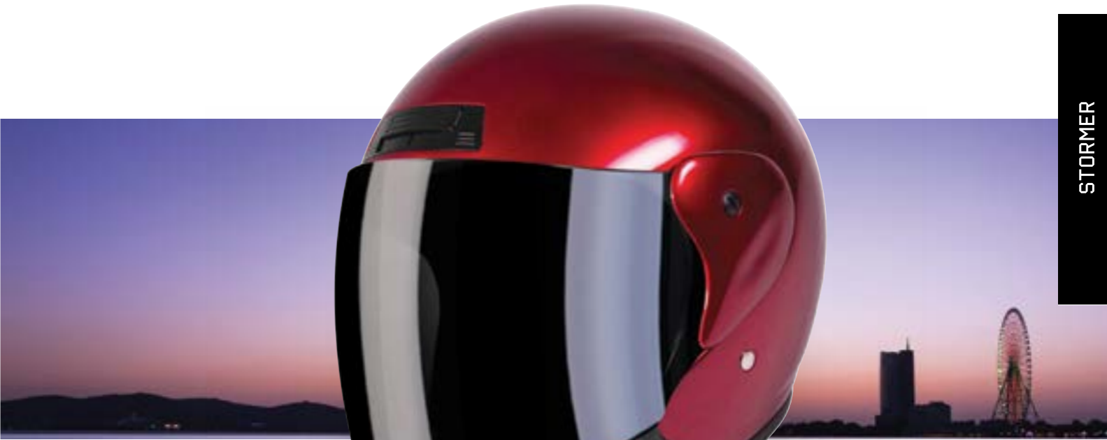
/ CALM RED METAL GLOSSY 40N-SNU-A09 XS à/à XL