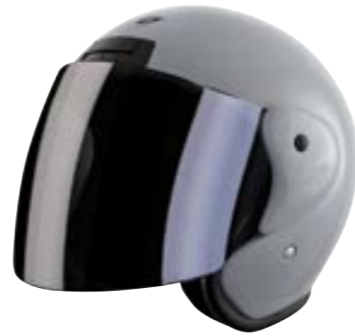
/ NARDO GREY GLOSSY 40N-SNU-A08 XS à/à XL