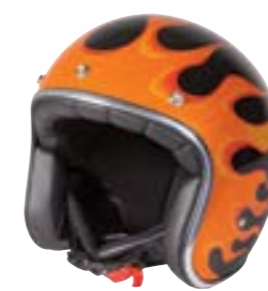
/ FIRE ORANGE METAL GLOSSY 40K-PED-Q02 XS à/à XL