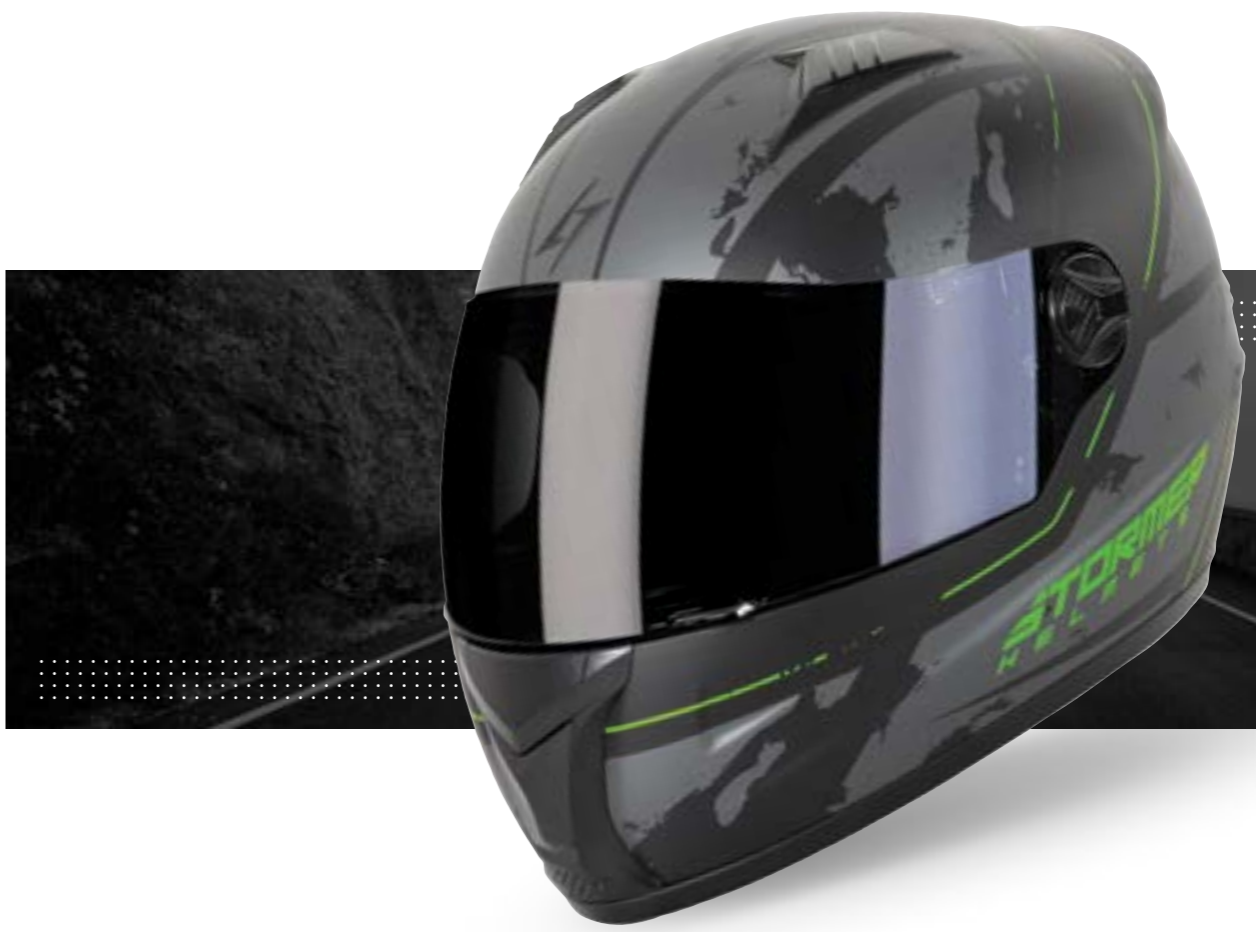
/ SHADE BLACK GREEN METAL MATT 40D-B01-C02 XS à/to XXL

INTÉGRAL FULL FACE XS > XXL (selon modèle) (according to the model)