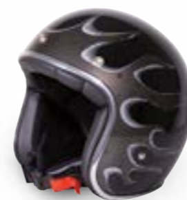
/ FIRE BLACK METAL GLOSSY 40K-PED-Q01 XS à/à XL

JET OPEN FACE XXS > XL (selon modèle) (according to the model)