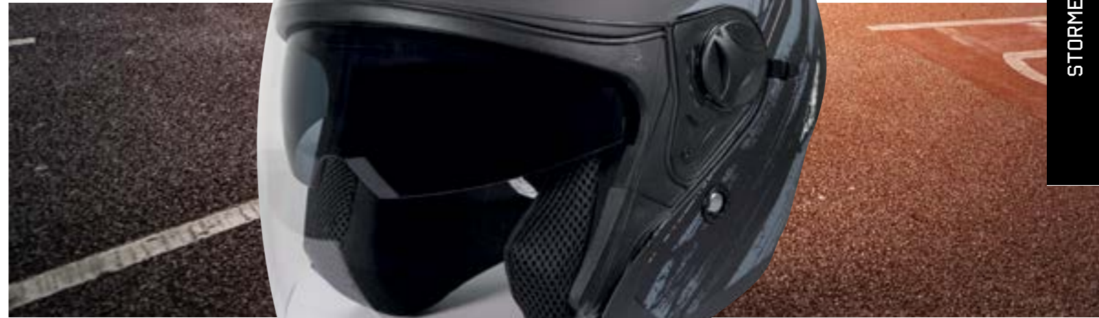
/ GREY MATT 40A-C01-B01 XS à/à XXL

JET OPEN FACE XS > XXL (selon modèle) (according to the model)