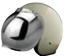
/ ÉCRAN BUBBLE IRIIDIUM / IRIIDIUM BUBBLE VISOR 4120-PEU-R20