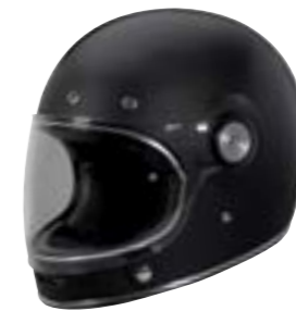
/ SOLID BLACK PEARLY 40A-G01-A02 XS à/à XL