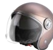
/ CHAMPAGNE PEARLY ... XS à/à XL