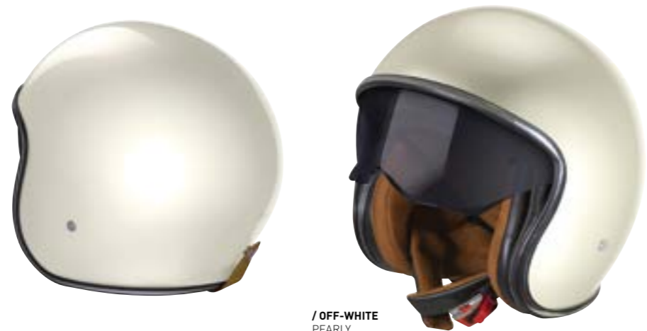
/ OFF-WHITE PEARLY 40A-B01-A04 XS à/à XXL