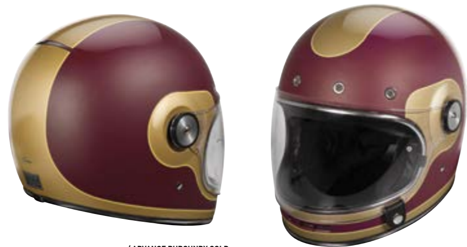
/ ADVANCE BURGUNDY GOLD PEARLY 40A-G01-B01 XS à/à XL