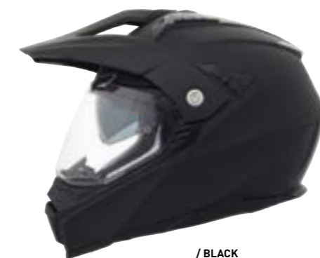
/ BLACK MATT 40D-C01-A03 XS à/à XL