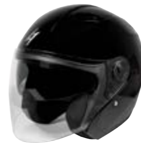
/ BLACK PEARLY 40A-C01-A01 XS à/à XXL

JET OPEN FACE XS > XXL (selon modèle) (according to the model)