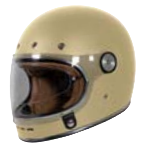
/ SOLID OFF-WHITE PEARLY 40A-G01-A03 XS à/à XL