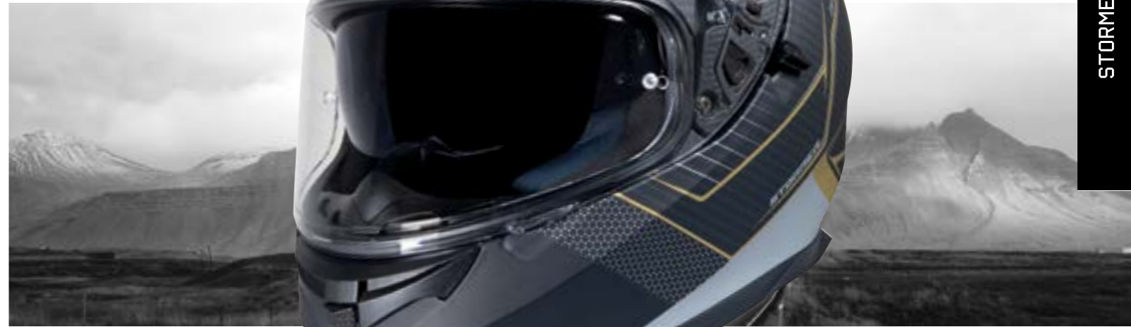
/ MILES GOLD METAL MATT 40A-A01-B01 XS à/à XXL

INTÉGRAL DOUBLE ÉCRAN FULL FACE DUAL SCREEN