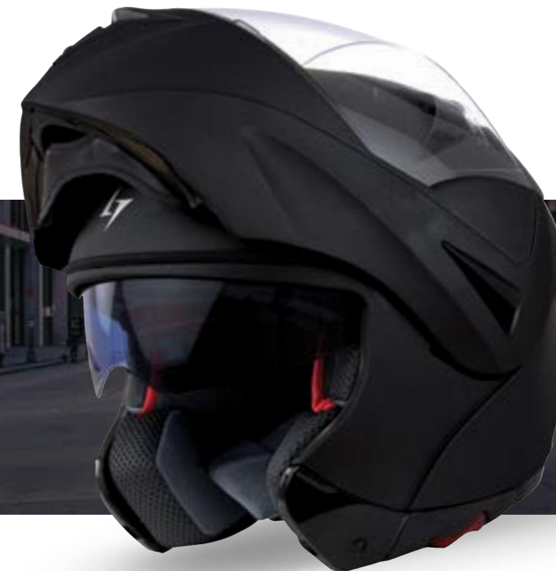
/ BLACK MATT 40H-A01-A02 XS à/à XL