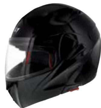
/ BLACK GLOSSY 40H-A01-A01 XS à/à XL