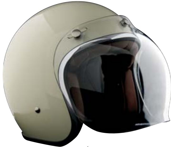
/ ÉCRAN BUBBLE CLAIR / CLEAR BUBBLE VISOR 4120-PEU-C20