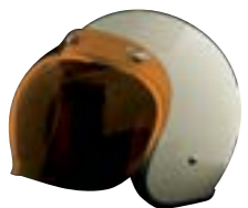
/ ÉCRAN BUBBLE ORANGE / ORANGE BUBBLE VISOR 4120-PEU-B02