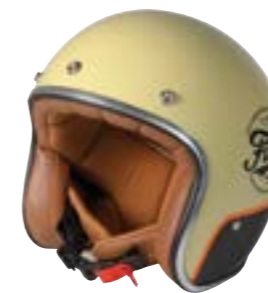
/ FUEL GLOSSY 40K-PED-R01 XS à/à XL