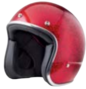
/ GLITTER RED GLOSSY 40K-PEU-P11 XXS à/à XL