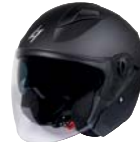
/ BLACK MATT 40A-C01-A02 XS à/à XXL