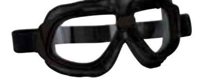
/ T10 MATT BLACK 40I-2710-T10