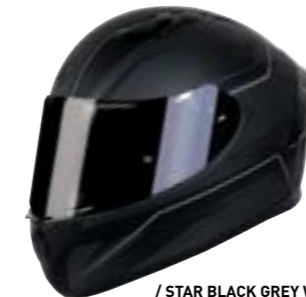
/ STAR BLACK GREY WHITE METAL MATT 40A-F01-B02 XS à/à XXL