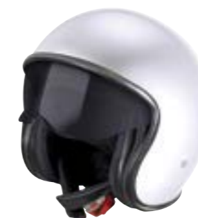
/ WHITE PEARLY 40A-B01-A03 XS à/à XXL