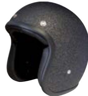
/ GLITTER BLACK MATT 40K-PEU-P13 XXS à/à XL