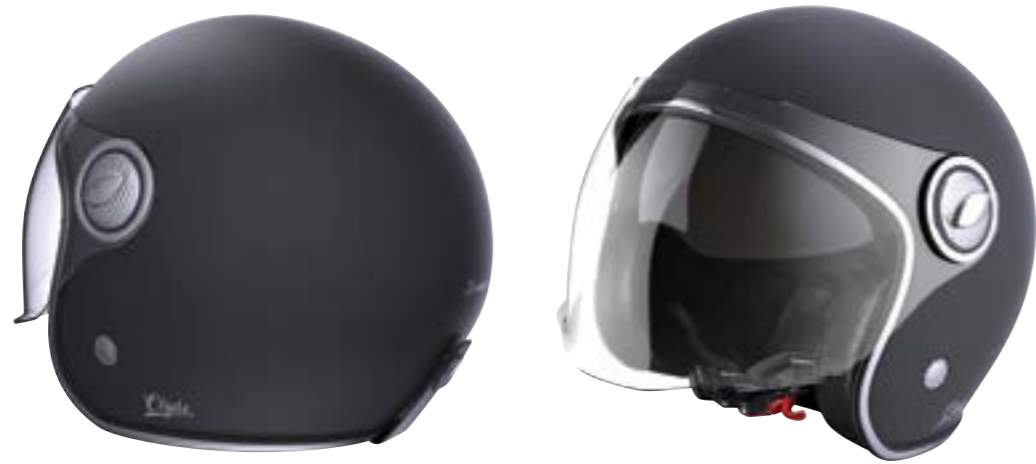
/ BLACK MATT ... XS à/à XL