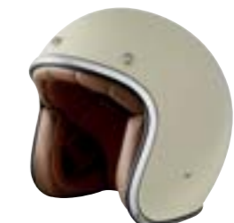
/ OFF-WHITE GLOSSY 40K-PEU-A01 XXS à/à XL