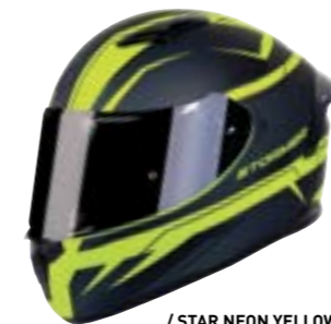
/ STAR NEON YELLOW BLACK GREY METAL MATT 40A-F01-B03 XS à/à XXL

PINLOCK 70 Pièce détaché disponible / available spare part LENTILLE PINLOCK 70* 4125-P02-A02