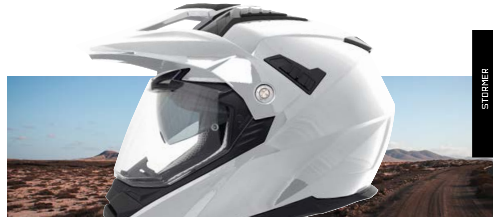
/ WHITE GLOSSY 40D-C01-A01 XS à/à XL