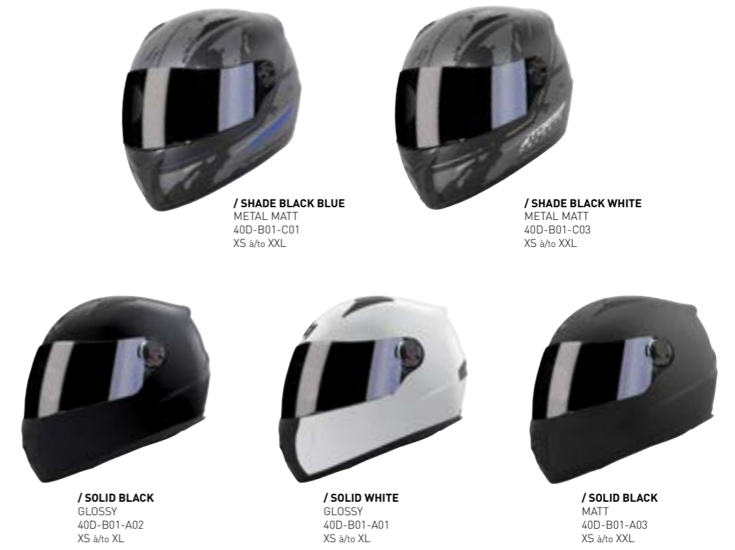
/ SHADE BLACK BLUE METAL MATT 40D-B01-C01 XS à/to XXL

INTÉGRAL FULL FACE XS > XXL (selon modèle) (according to the model)