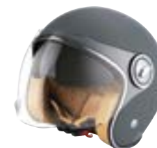
/ KAKI MATT ... XS à/à XL