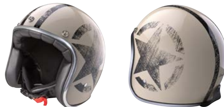
/ STAR OFF-WHITE PEARLY 40K-PED-S01 XS à/ro XL