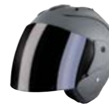
/ GREY MATT 40G-C01-A02 XS à/à XL