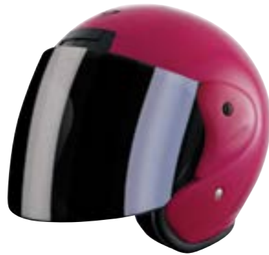
/ FUCHSIA GLOSSY 40N-SNU-A07 XS à/à XL