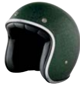
/ GLITTER GREEN GLOSSY 40K-PEU-P14 XXS à/à XL