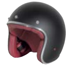
/ BLACK MATT 40K-PEU-N26 XXS à/à XL