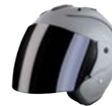
/ NARDO GREY GLOSSY 40G-C01-C01 XS à/à XL