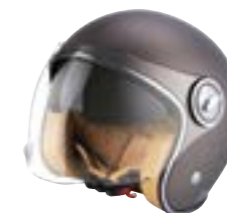
/ CHOCOLATE METAL MATT ... XS à/à XL