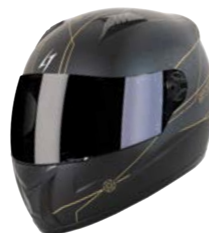
/ FLORA BLACK GOLD METAL MATT 40D-B01-E02 XS à/à XL

INTÉGRAL FULL FACE XS > XXL (selon modèle) [according to the model]