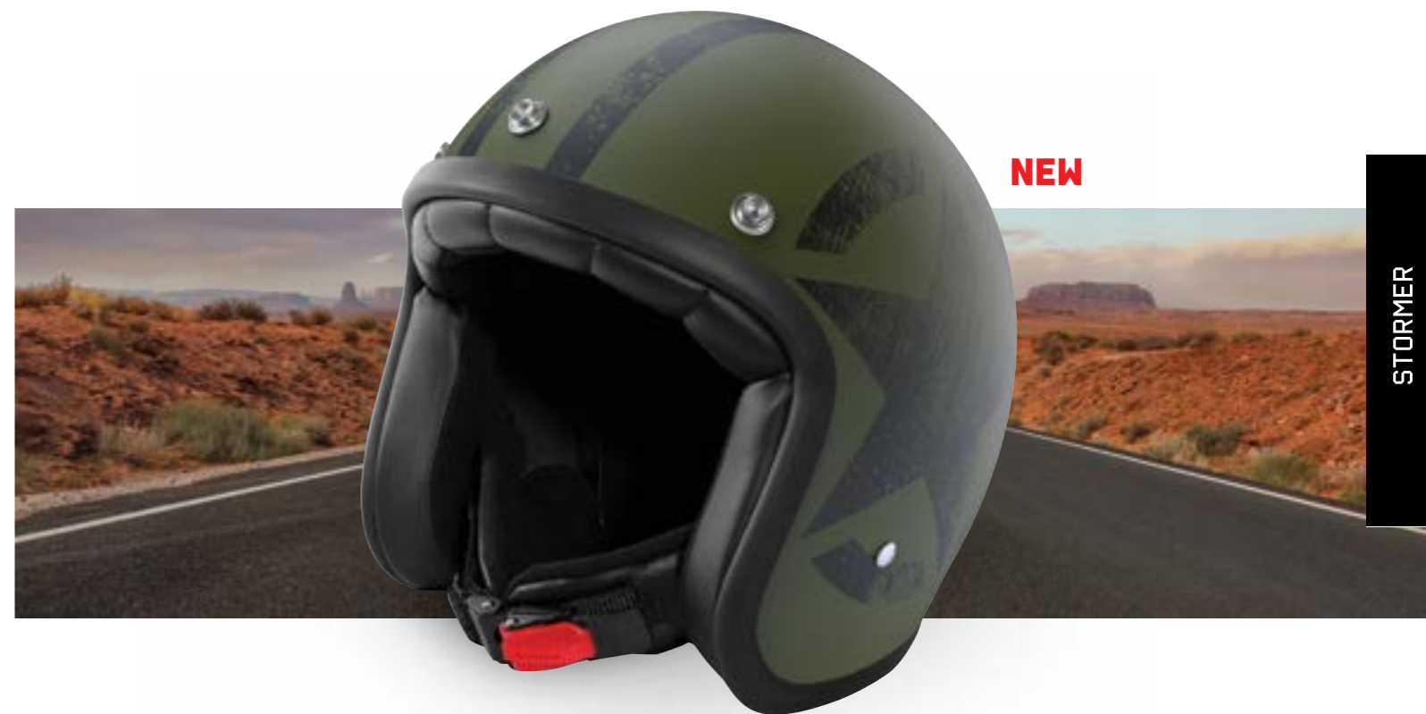
/ STAR KAKI MATT 40K-PED-S02 XS à/ro XL