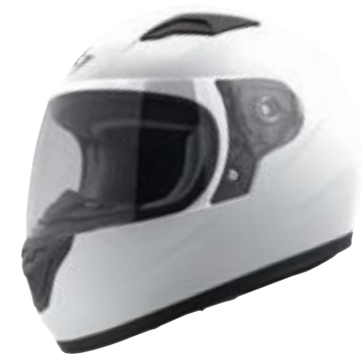
/ WHITE GLOSSY 40D-F01-A01 SM à/à LG