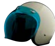
/ ÉCRAN BUBBLE BLEU / BLUE BUBBLE VISOR 4120-PEU-B01