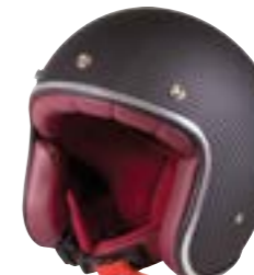
/ CARBON MATT 40K-PED-N01 XS à/à XL