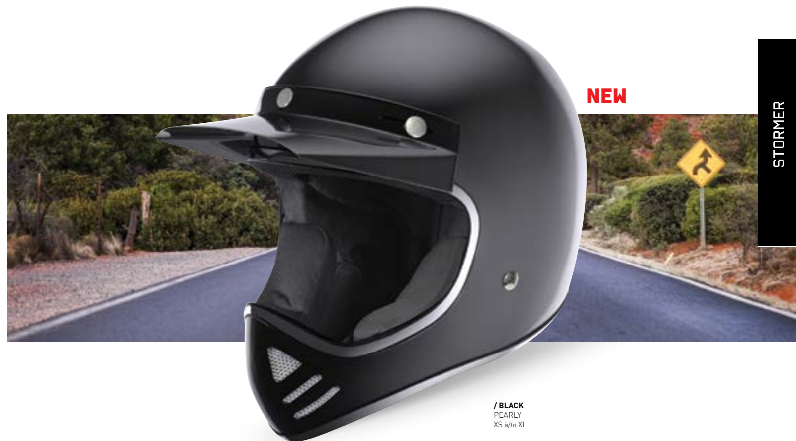
/ BLACK PEARLY XS à/à XL