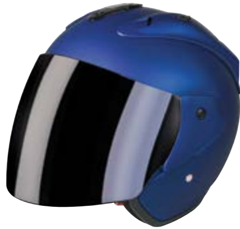
/ METAL DEEP BLUE MATT 40G-C01-C03 XS à/à XL