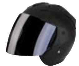
/ BLACK GLOSSY 40G-C01-B01 XS à/à XL