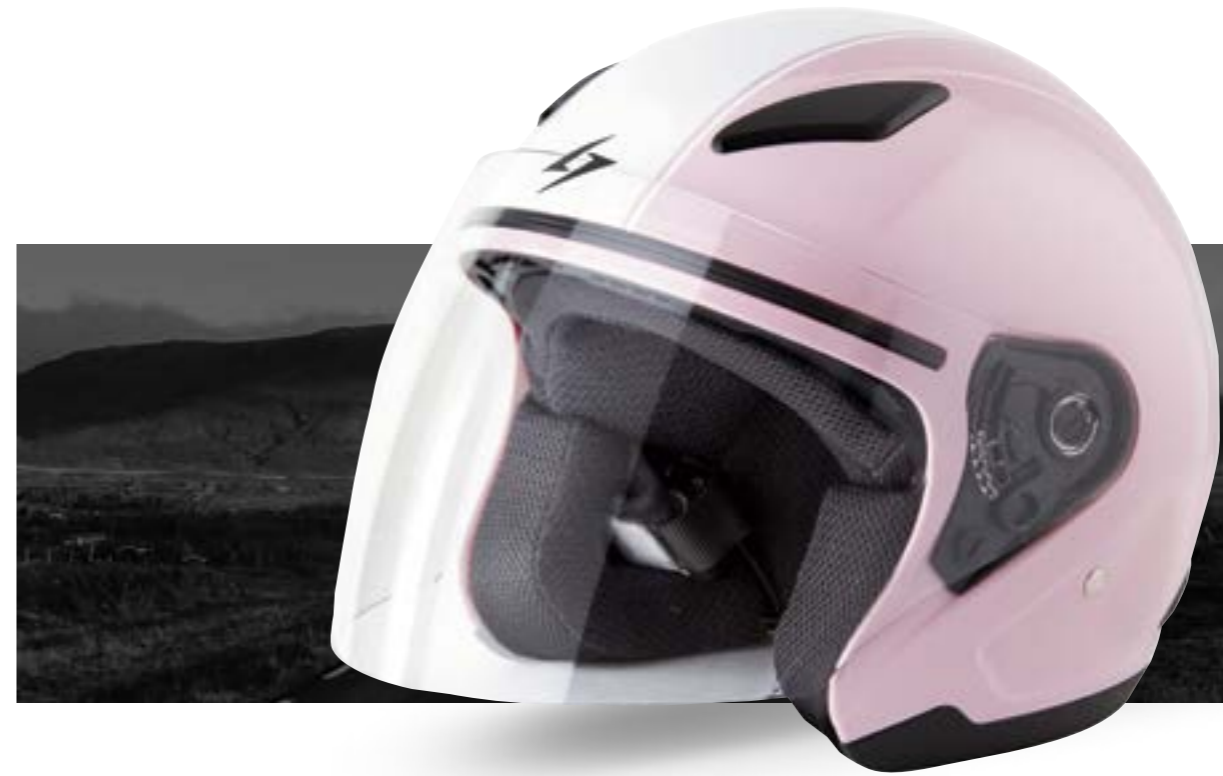
/ KOKOALA GLOSSY 40R-FSD-KK1 XS à/à MD