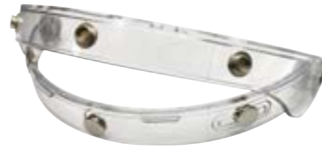
/ CHARNIÈRE ÉCRAN PEARL TRANSPARENT / TRANSPARENT PEARL VISOR HINGE 4125-PEU-A01