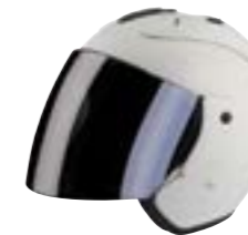
/ WHITE GLOSSY 40G-C01-B02 XS à/à XL