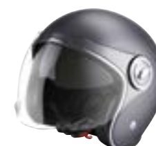
/ TITANIUM GREY METAL MATT ... XS à/à XL