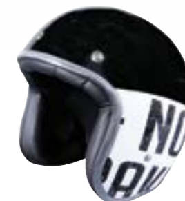
/ BRAKIN GLOSSY 40K-PED-K01 XS à/à XL