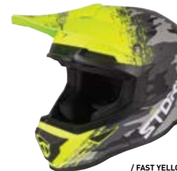
/ FAST YELLOW MATT 40A-D01-A02 XS à/à XXL