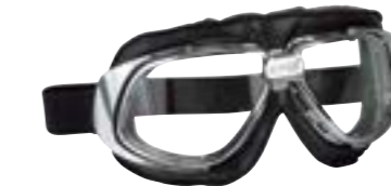
/ T10 CHROME 40I-2700-T10