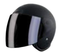
/ BLACK MATT 40Q-SNU-N26 XS à/à XL