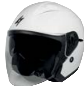
/ WHITE PEARLY 40A-C01-A03 XS à/à XXL