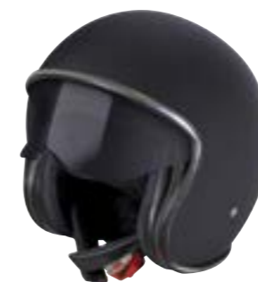
/ BLACK MATT 40A-B01-A02 XS à/à XXL

JET OPEN FACE XS > XXL [selon modèle] [according to the model]