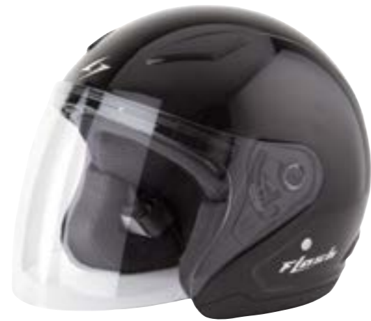
/ BLACK GLOSSY 40R-FSU-N10 XS à/à MD