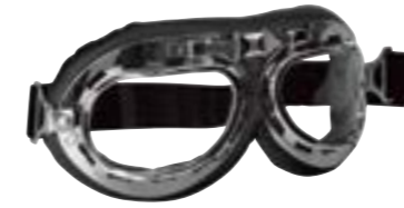
/ T01 CHROME 40I-2700-T01