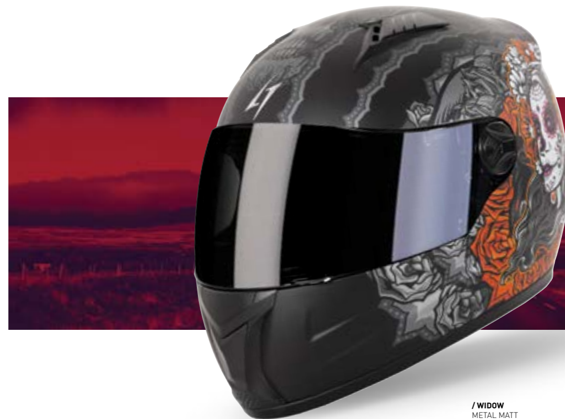
/ WIDOW METAL MATT 40D-B01-D01 XS à/à XXL

INTÉGRAL FULL FACE XS > XXL (selon modèle) [according to the model]