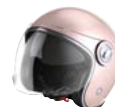
/ PALE PINK PEARLY ... XS à/à XL