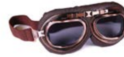
/ T01 RETRO 40I-2720-T01