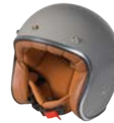
/ NARDO GREY GLOSSY 40K-PEU-A04 XXS à/à XL

JET OPEN FACE XXS > XL (selon modèle) (according to the model)