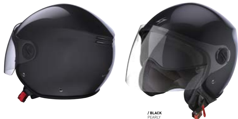
/ BLACK PEARLY 409-B01-A02 XS à/à XL