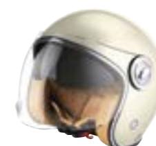
/ OFF-WHITE PEARLY ... XS à/à XL