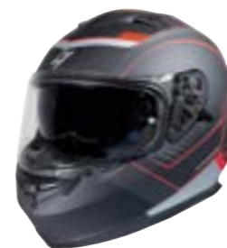
/ MILES RED METAL MATT 40A-A01-B02 XS à/à XXL

PINLOCK 70 Pièce détachée disponible / available spare part LENTILLE PINLOCK 70* 4125-P02-A02