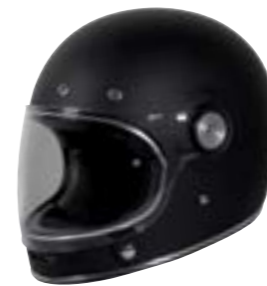
/ SOLID BLACK MATT 40A-G01-A01 XS à/à XL