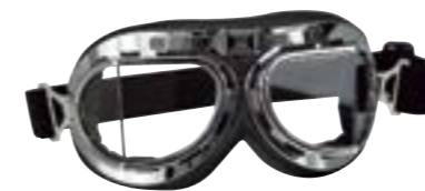
/ T08 CHROME 40I-2700-T08