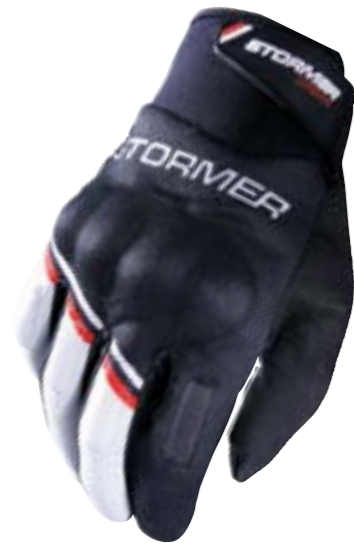
/ BLACK RED 8 à/to 13 / 40C-13A1-A01