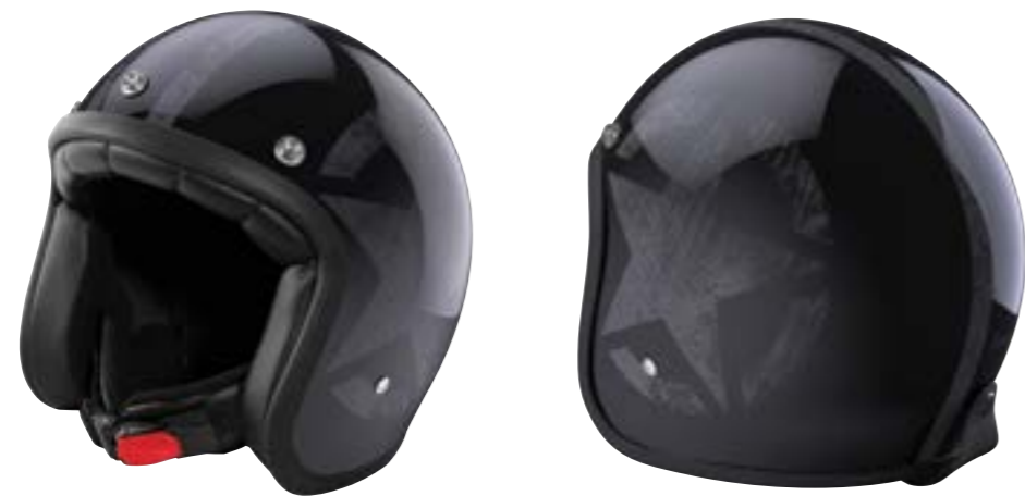
/ STAR BLACK PEARLY 40K-PED-S03 XS à/ro XL