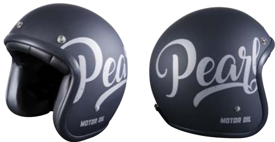
/ OIL MATT 40K-PED-L01 XS à/à XL