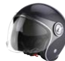
/ BLACK PEARLY ... XS à/à XL