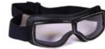
/ T05 BLACK 40I-2710-T05