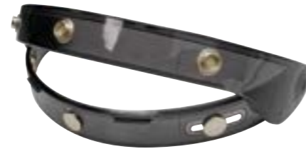
/ CHARNIÈRE ÉCRAN PEARL NOIR / BLACK PEARL VISOR HINGE 4125-PEU-A02