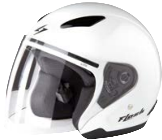
/ WHITE GLOSSY 40R-FSU-B10 XS à/à MD