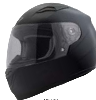
/ BLACK GLOSSY 40D-F01-A02 SM à/à LG