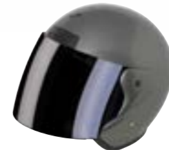
/ GREY GLOSSY 40N-SNU-G11 XS à/à XL