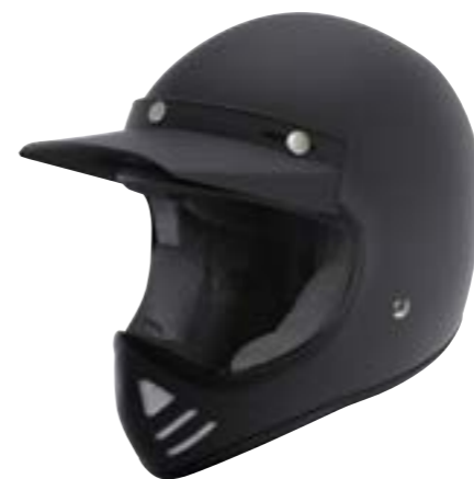
/ BLACK MATT XS à/à XL