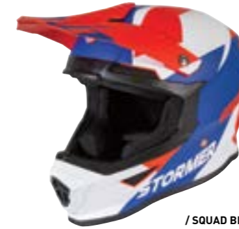
/ SQUAD BLUE RED GLOSSY 40A-D01-B02 XS à/à XXL