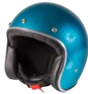
/ GLITTER TURQUOISE GLOSSY 40K-PED-M02 XXS à/à XL