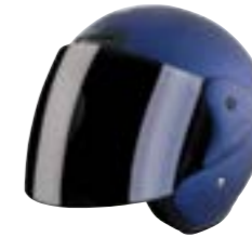
/ ROYAL BLUE METAL MATT 40N-SNU-A06 XS à/à XL