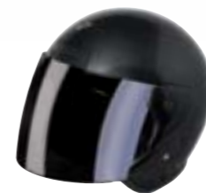
/ BLACK GLOSSY 40R-SNU-N10 XS à/à XL