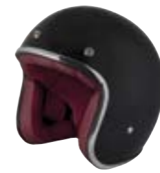
/ BLACK GLOSSY 40K-PEU-N10 XXS à/à XL