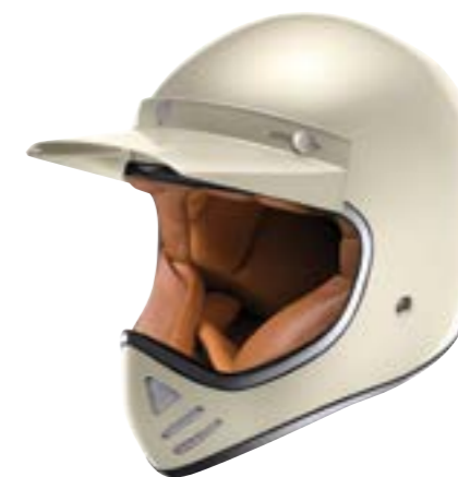
/ OFF-WHITE PEARLY XS à/à XL