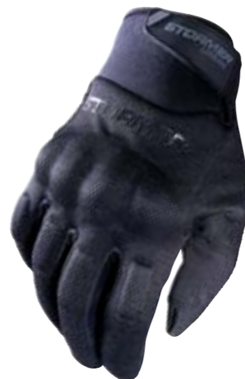
/ BLACK 8 à/to 13 / 40C-13A1-A03