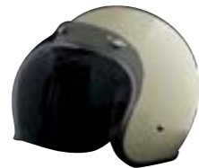
/ ÉCRAN BUBBLE FUMÉ / SMOKE BUBBLE VISOR 4120-PEU-S20