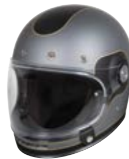
/ ADVANCE GREY BLACK METAL MATT 40A-G01-B03 XS à/à XL