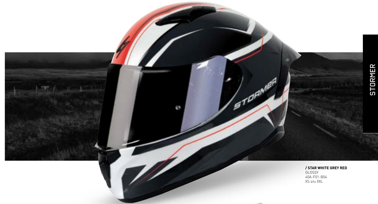
/ STAR WHITE GREY RED GLOSSY 40A-F01-B04 XS à/à XXL