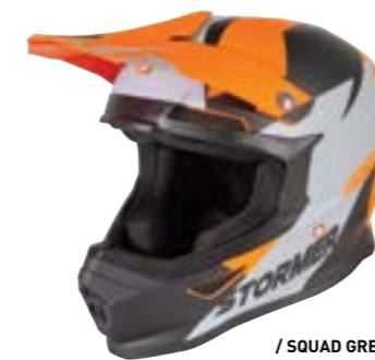
/ SQUAD GREY ORANGE MATT 40A-D01-B03 XS à/à XXL

OFF-ROAD XS > XXL (selon modèle) (according to the model)