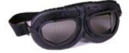
/ T08 BLACK 40I-2710-T08