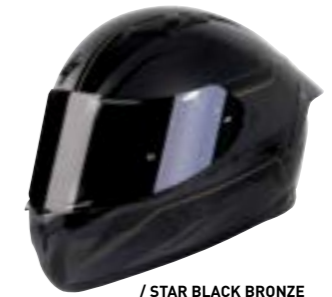
/ STAR BLACK BRONZE GLOSSY 40A-F01-B01 XS à/à XXL