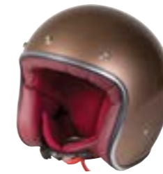
/ CHAMPAGNE GLOSSY 40K-PEU-A02 XXS à/à XL