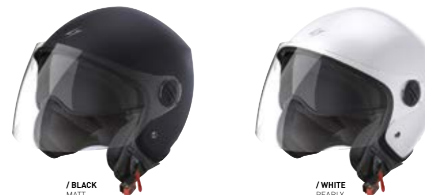
/ BLACK MATT 409-B01-A01 XS à/à XL