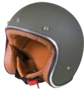
/ KAKI MATT 40K-PEU-A03 XS à/à XL