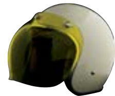
/ ÉCRAN BUBBLE JAUNE / YELLOW BUBBLE VISOR 4120-PEU-J20