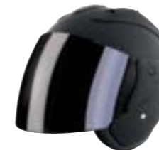
/ BLACK MATT 40G-C01-A01 XS à/à XL