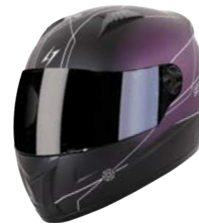
/ FLORA BLACK FUCHSIA METAL MATT 40D-B01-E01 XS à/à XL