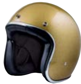
/ GLITTER GOLD GLOSSY 40K-PEU-P12 XXS à/à XL