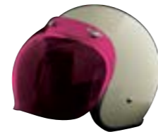
/ ÉCRAN BUBBLE ROSE / PINK BUBBLE VISOR 4120-PEU-B03