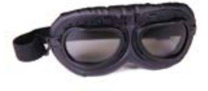
/ T01 BLACK 40I-2710-T01