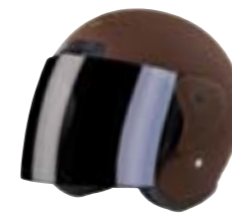
/ CHOCOLATE MATT 40N-SNU-C15 XS à/à XL