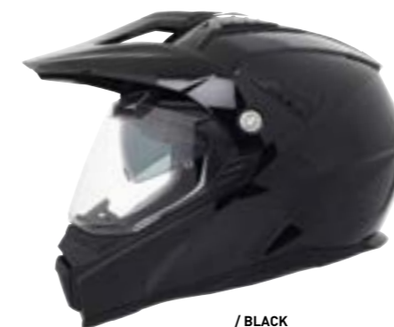
/ BLACK GLOSSY 40D-C01-A02 XS à/à XL

OFF-ROAD XS > XL (selon modèle) / (according to the model)