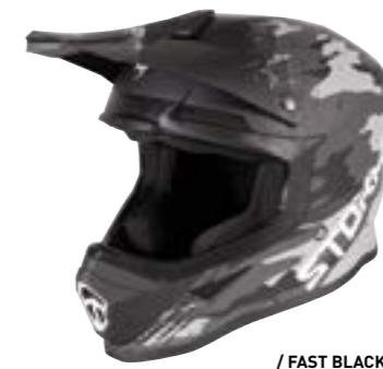
/ FAST BLACK MATT 40A-D01-A01 XS à/à XXL