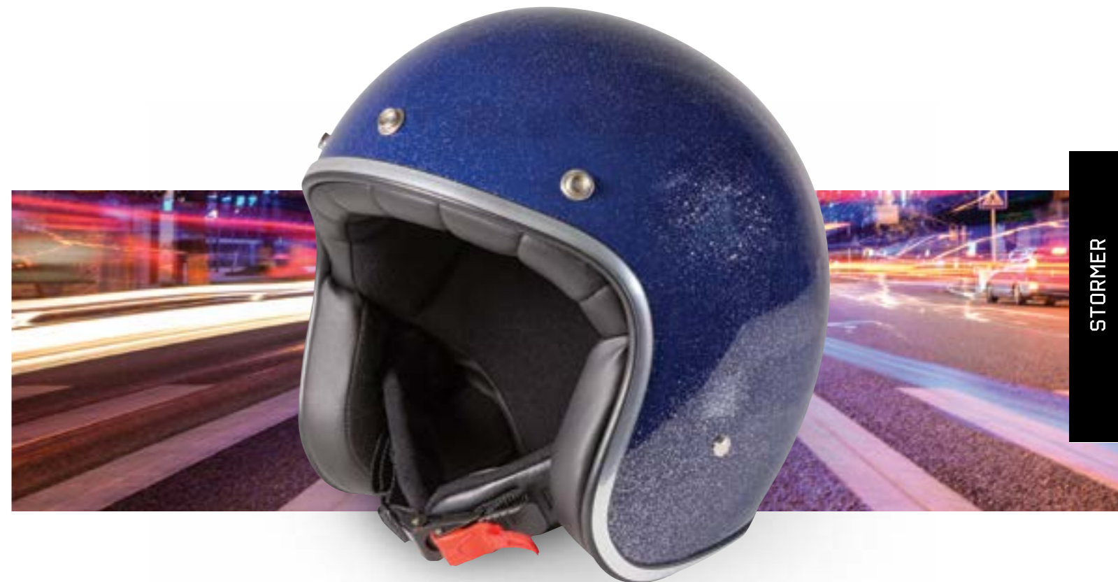
/ GLITTER NAVY BLUE GLOSSY 40K-PED-M01 XXS à/à XL

JET OPEN FACE XXS > XL (selon modèle) (according to the model)