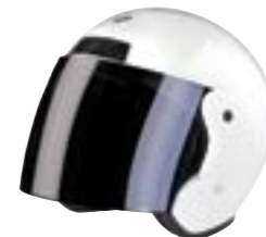
/ WHITE GLOSSY 40N-SNU-B10 XS à/à XL