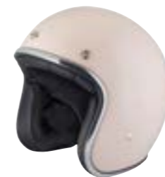
/ PALE PINK GLOSSY 40K-PEU-B01 XXS à/à XL