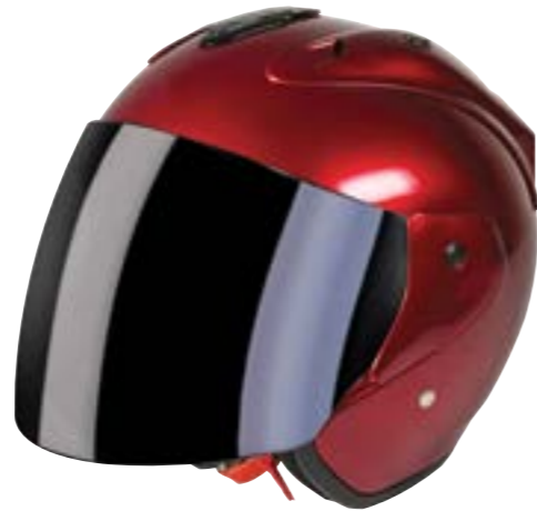
/ METAL CALM RED GLOSSY 40G-C01-C02 XS à/à XL