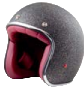
/ GLITTER BLACK GLOSSY 40K-PEU-P10 XXS à/à XL