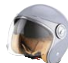
/ NARDO GREY GLOSSY ... XS à/à XL