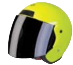
/ NEON YELLOW GLOSSY 40N-SNU-A10 XS à/à XL