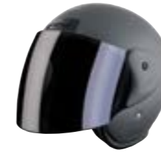
/ GREY MATT 40N-SNU-G18 XS à/à XL