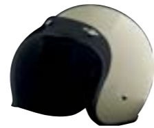
/ ÉCRAN BUBBLE FUMÉ FONCÉ / DARK SMOKE BUBBLE VISOR 4120-PEU-S25