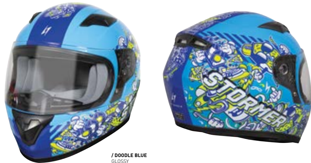
/ DOODLE BLUE GLOSSY 40D-F01-C02 SM à/à LG