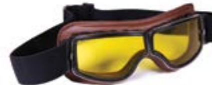
/ T05 RETRO 40I-2720-T05