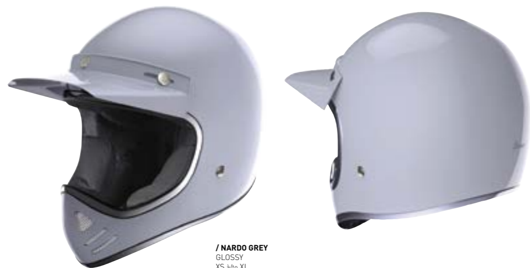
/ NARDO GREY GLOSSY XS à/à XL