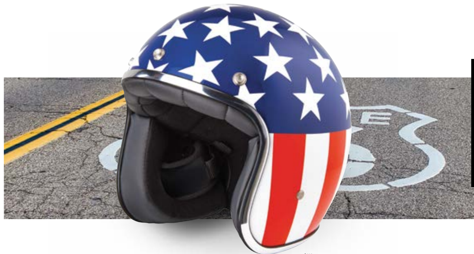
/ US GLOSSY 40K-PED-E01 XS à/à XL