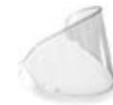
PINLOCK 70 Pièce détachée disponible / available spare part LENTILLE PINLOCK 70' 4125-P02-A01

OFF-ROAD XS > XL (selon modèle) / (according to the model)